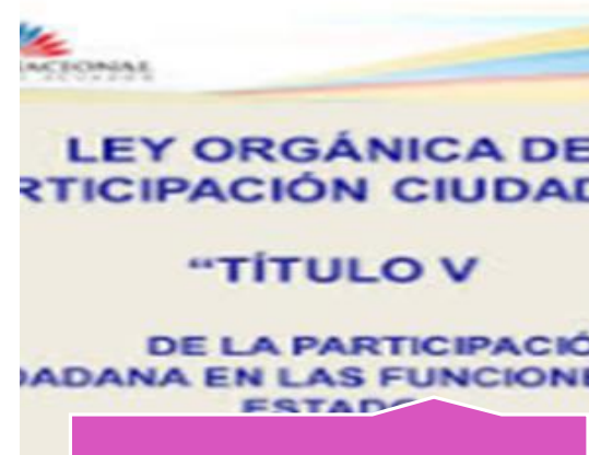
LEY ORGÁNICA DE PARTICIPACIÓN CIUDADANA