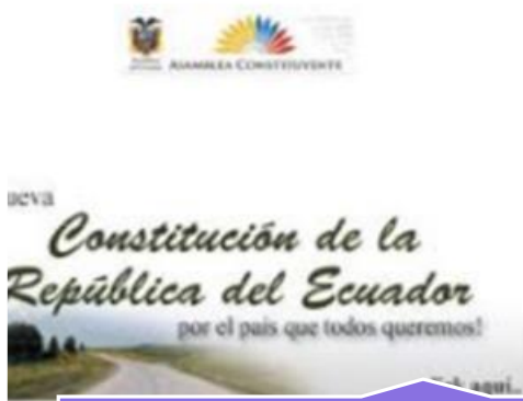
CONSTITUCIÓN DE LA REPÚBLICA DEL ECUADOR