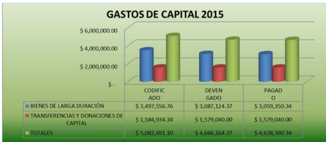
GRAFICO No. 10