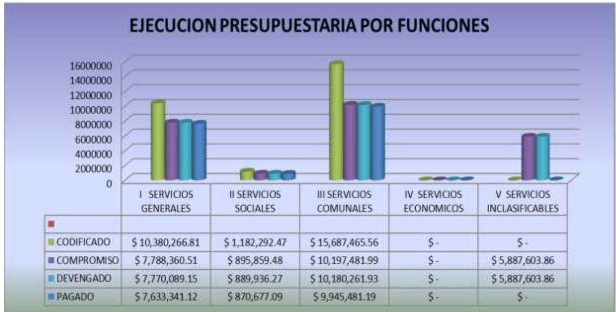
GRAFICO No. 5