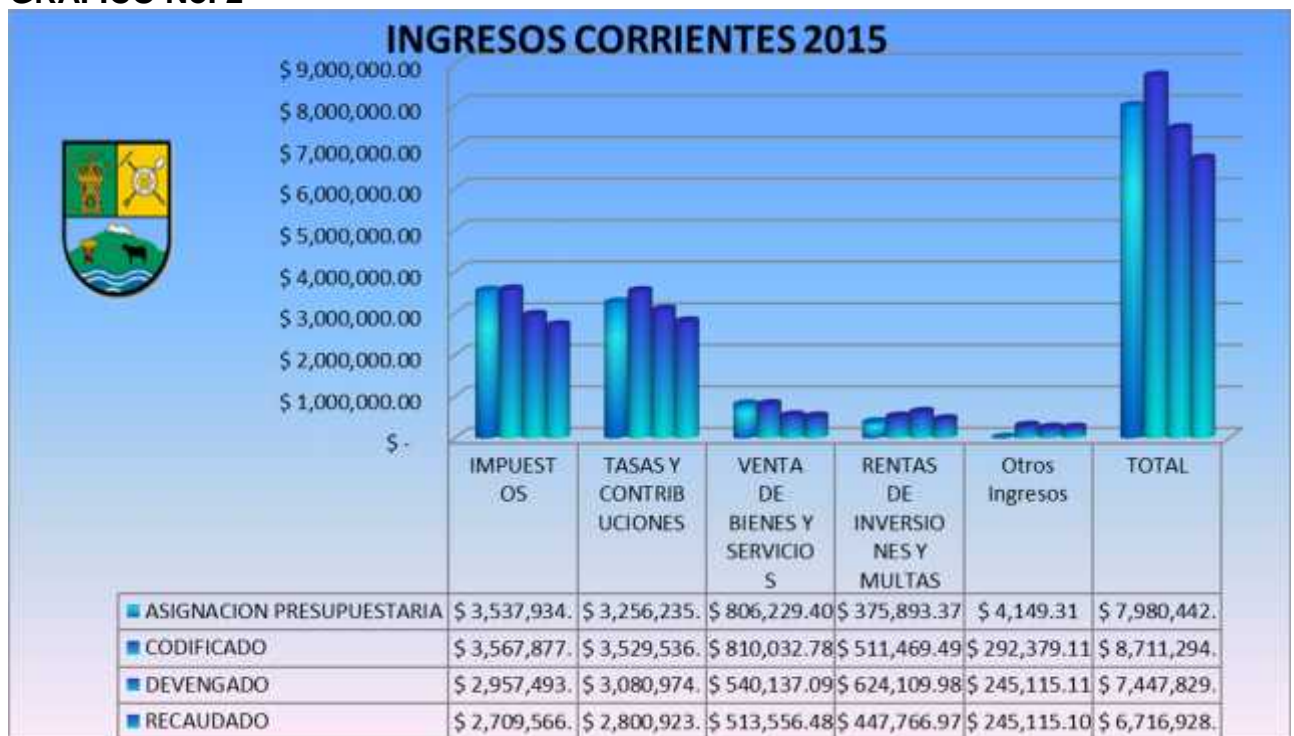
GRAFICO No. 2