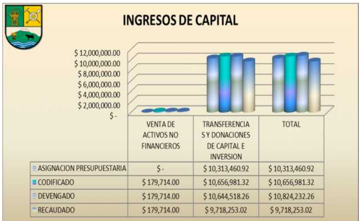
GRAFICO No. 3