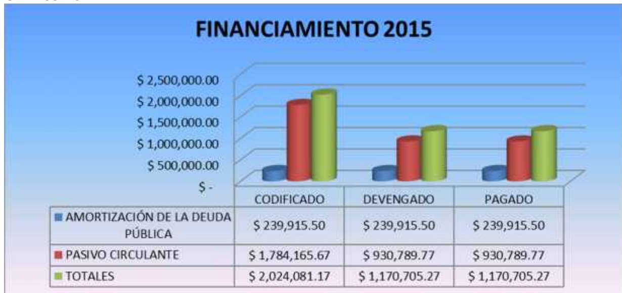
GRAFICO No. 11