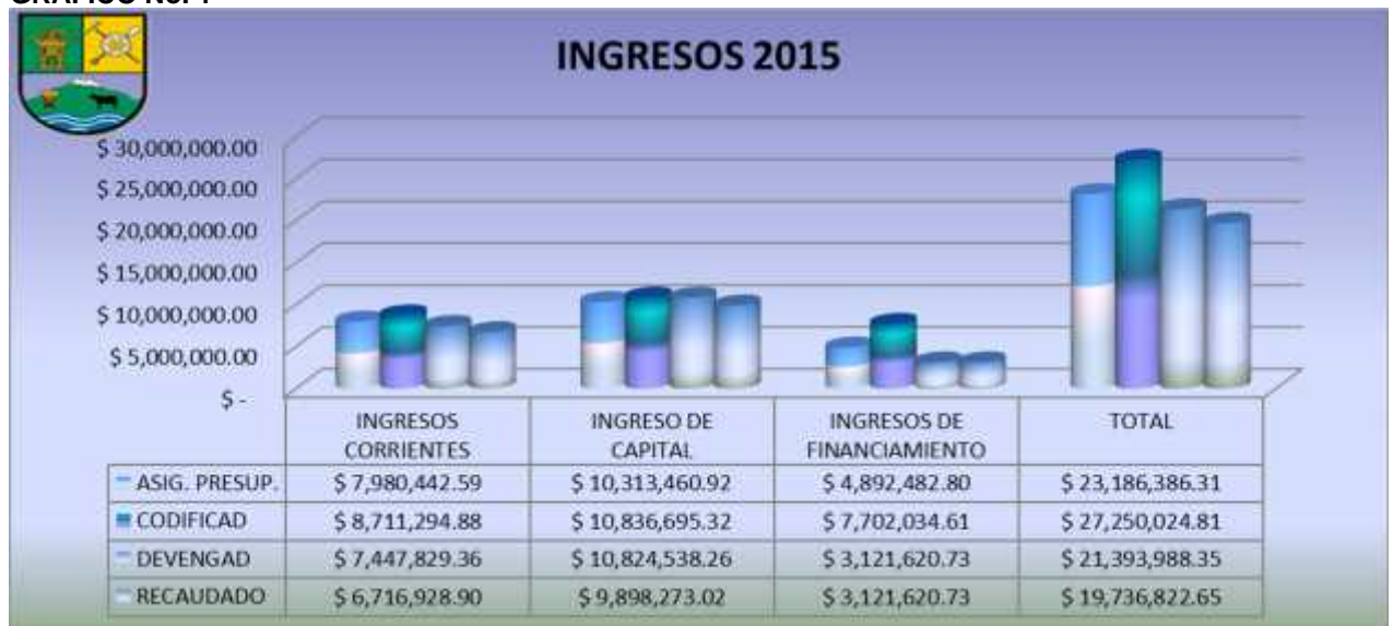
GRAFICO No. 1

FUENTE: CÉDULA PRESUPUESTARIA DE INGRESOS DE DICIEMBRE DEL AÑO 2015