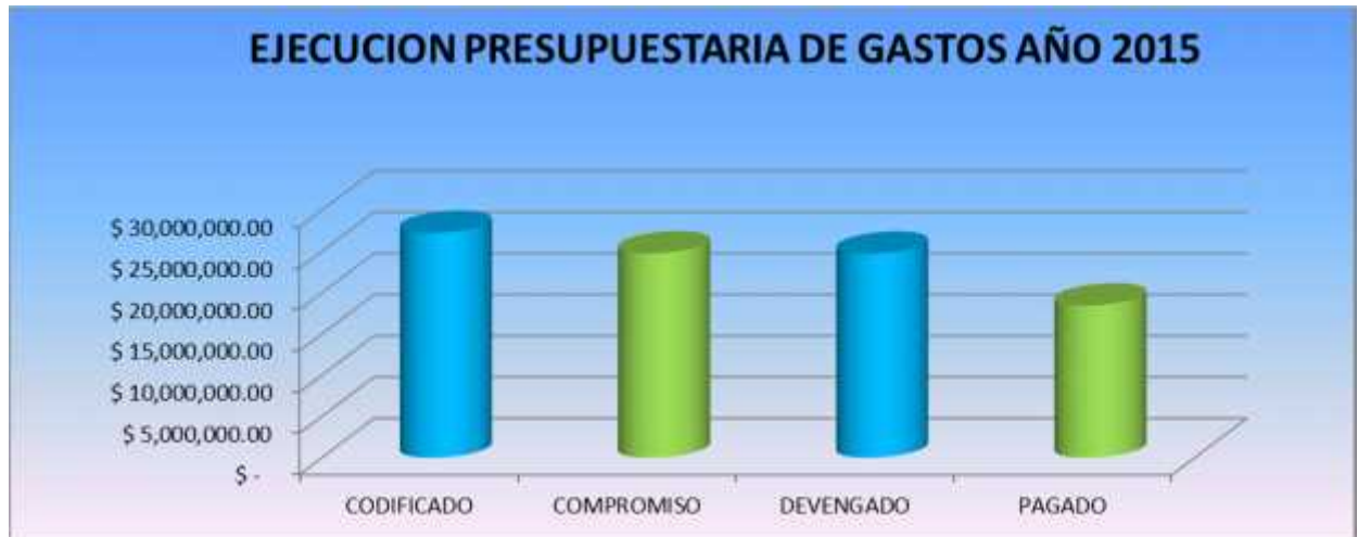
GRAFICO No. 7