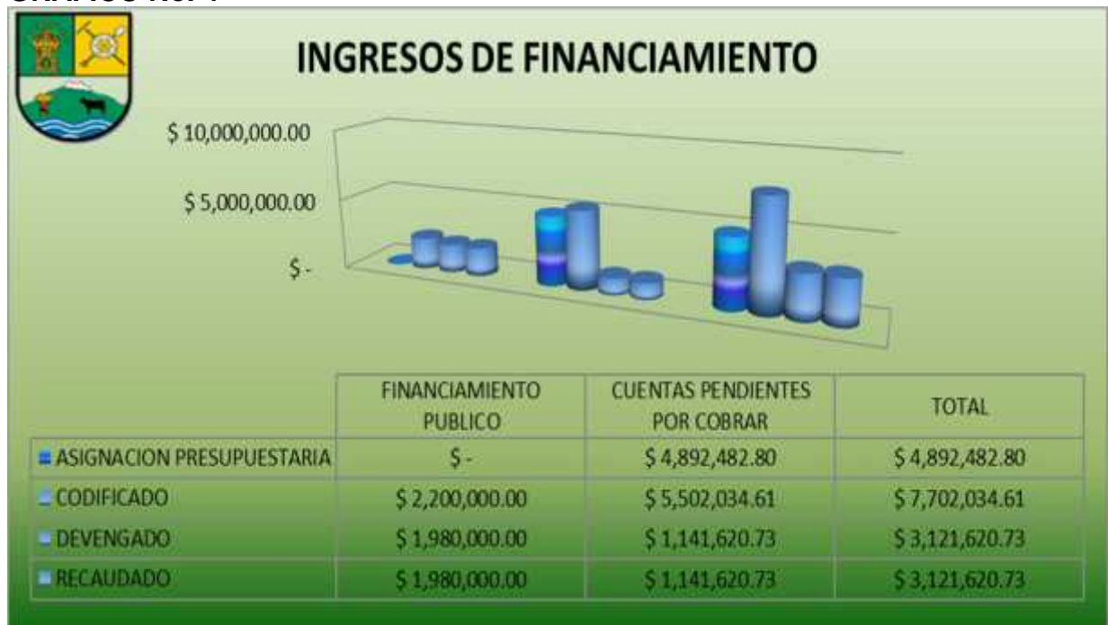
GRAFICO No. 4