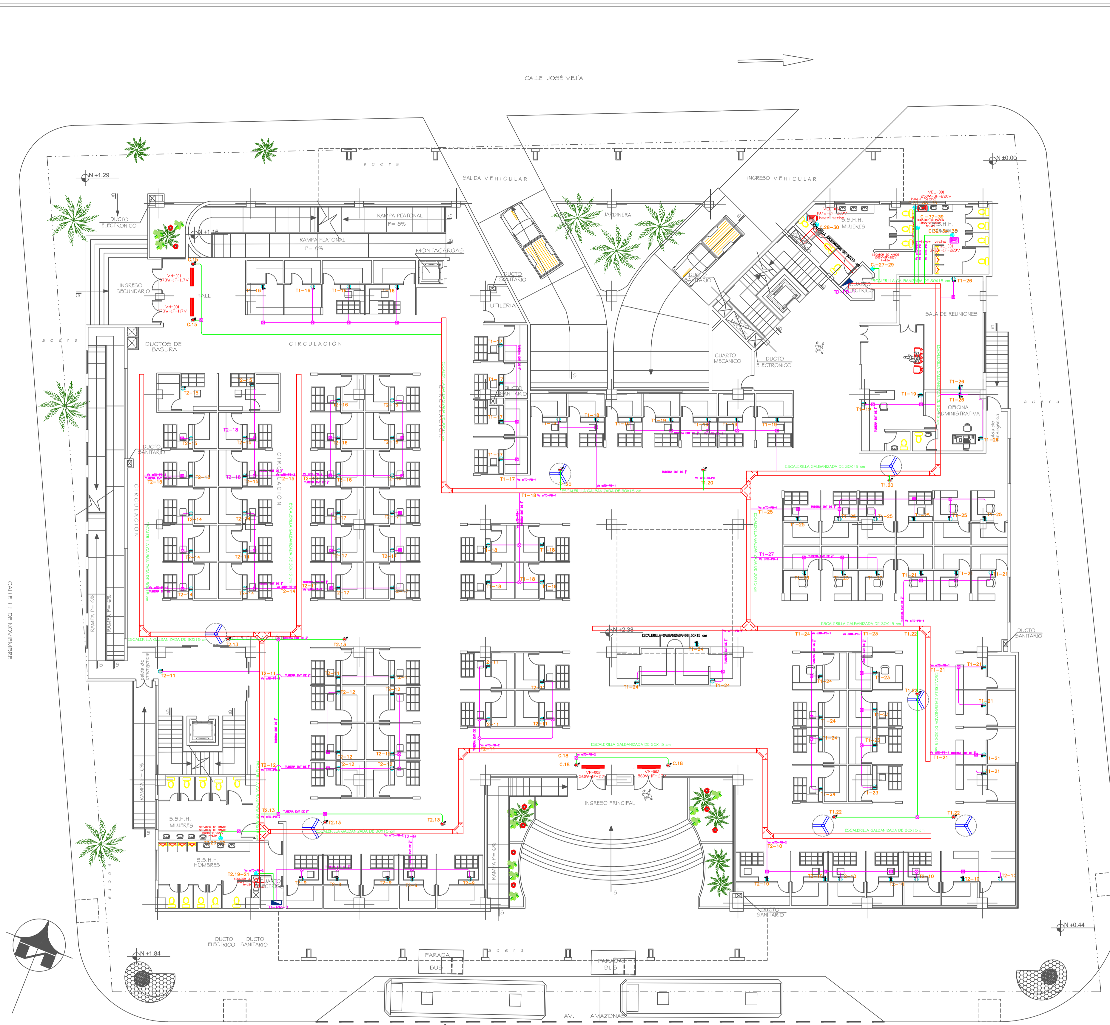
PLANTA BAJA ESCALA: 1 : 150