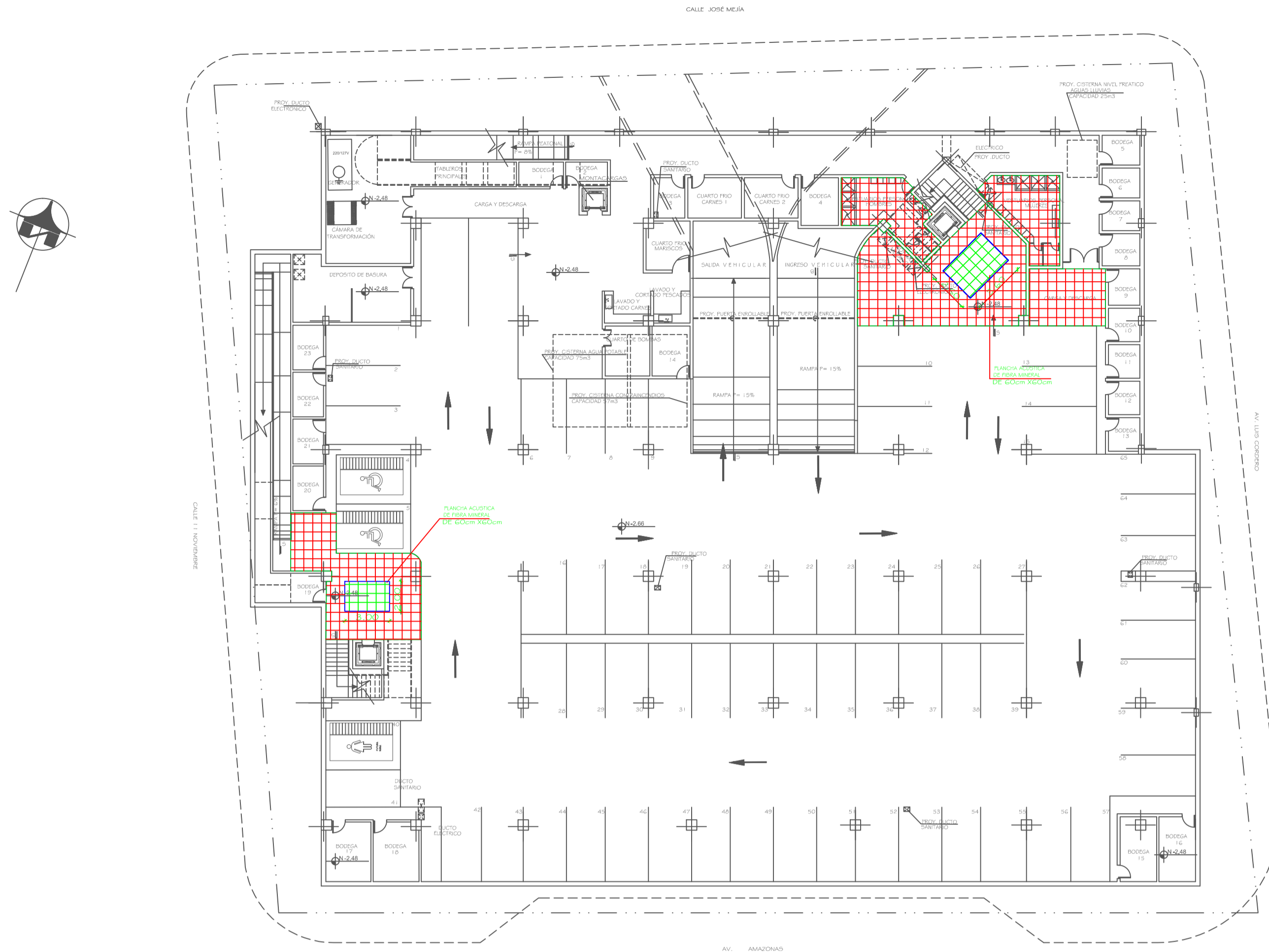
PLANTA SUBSUELO N. -2,66 ESCALA: 1:250